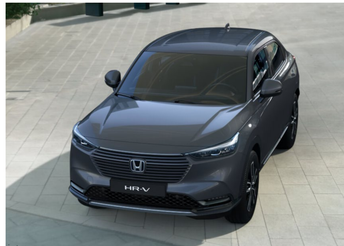
خاکستری شهاب سنگ